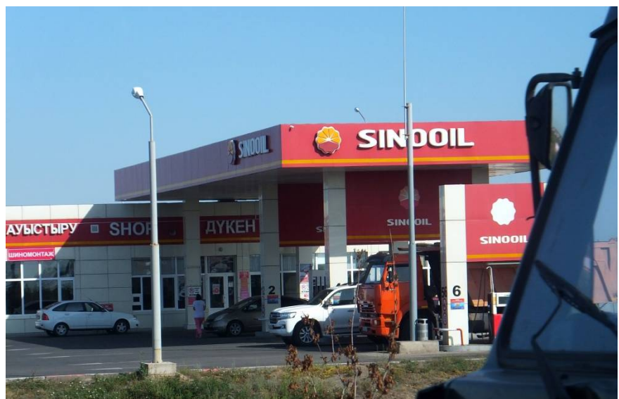
写真 9 中国資本のガソリンスタンド

二つ目は、昨年発生した改正土地法問題です。カザフ政府は、同法改正によって外国人への土地賃貸期間を従来の 5 年間から 25 年間に延長しようとしたものの（カザフでは外国人の土地所有は認められていません）、