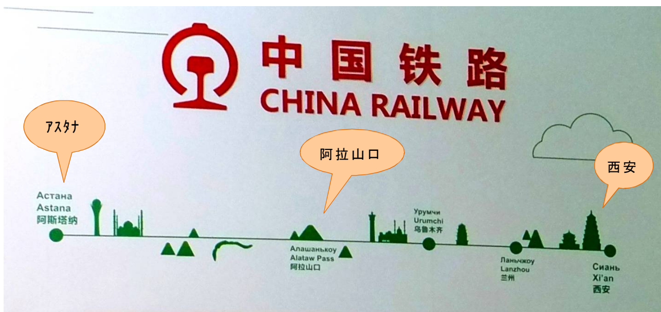
写真 3 EXPO 中国館にて

タンであり、広大な国土を持つ同国を抜け、ロシアを過ぎれば、東欧、そして西欧。地図を眺めると、その重要性に合点がいきます。一方のカザフ側でも、2000年代に入ると、中部のジェズカズガンからカスピ海に近い西部のベイネウに伸びる鉄道（約900Km。写真4）が敷設されるなどしています。ナザルバエフ大統領が近年提起した「ヌルルイ・ジョル」（新経済政策「光明の道」）と「一帯一路」の合流で、カザフ国内の交通インフラ整備がさらに進むという明るい未来像が描かれているようです。